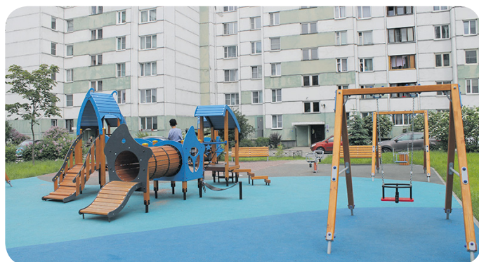
Комплексное благоустройство по адресу: ул. Генерала Симоняка, д. 4, корп. 5