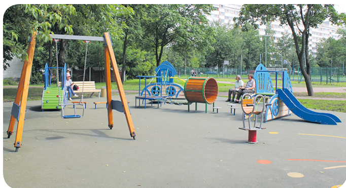
Комплексное благоустройство по адресу: пр. Ветеранов, д.78