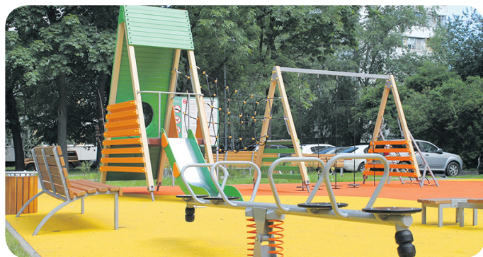
Комплексное благоустройство по адресу: ул. Генерала Симоняка, 27/193