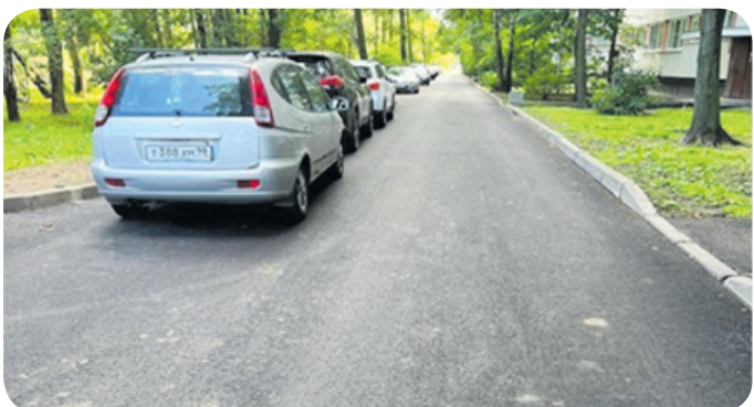
Ремонт асфальтобетонного покрытия: пр. Ветеранов, д.99